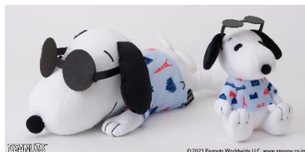
ぬいぐるみ M ¥4,510、ぬいぐるみ S ¥1,760