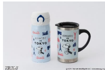
ワンタッチボトル(350ml) ¥4,400、 ステンレススリムマグ(290ml) ¥3,080