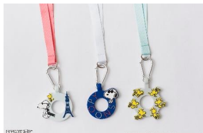
ペットボトルホルダー 各¥1,650