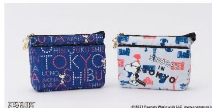
W ファスナーポーチ 各¥2,750