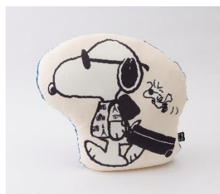
クール T-BOX クッション ¥3,520