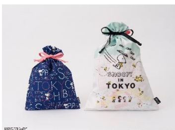
巾着 M ¥1,760、巾着 L ¥2,200