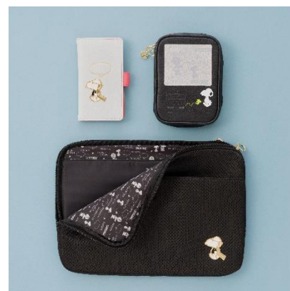
写真左：豆皿 各¥880、鉄玉(南部鉄器) ¥2,420、レスト 各¥880、箱入り箸 ¥1,100 写真中央：トラベルタンブラー(350ml) ¥3,520、ボトルホルダー ¥2,200、簡易保冷2WAY バッグ(店舗限定販売) ¥3,300、ぬいぐるみ M ¥4,510 写真右：フォンケース ¥3,300、ポーチ ¥2,200、ショルダー付バッグ ¥3,850