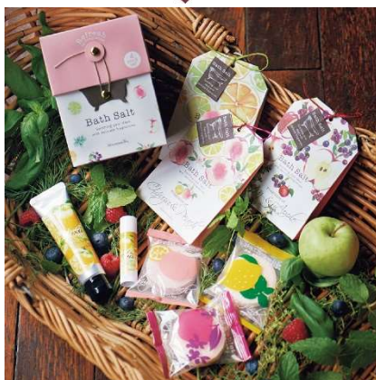
バスソルトセット (4個セット) ¥1,188、バスソルト (シトラス & ハーブ、ユズ&ピーチ、ペリー&アップル) 各 ¥302、バスタブレット (シトラス&ハーブ、ユズ&ピーチ、ペリー&アップル) 各 ¥162、リップクリーム (ユズ) ¥756、ハンドクリーム S (ユズ) ¥864