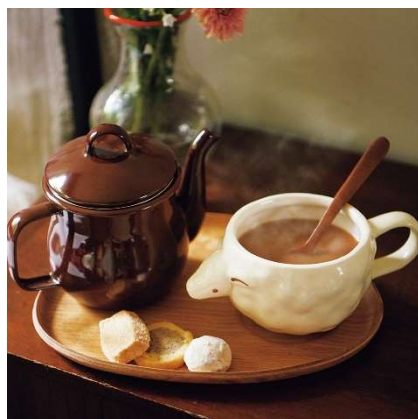
ホーローポット ¥4,212、羊マグカップ ¥1,620、ウッズブーン ¥432