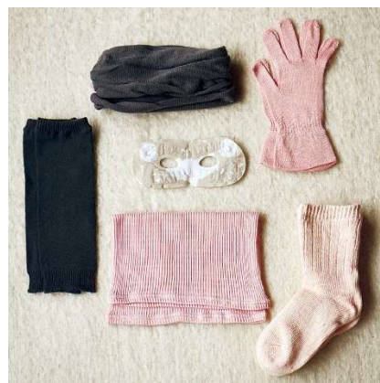
シルクネックウォーマー ¥3,780、シルクグローブ ¥1,296、シルククックス ¥2,376、シルク腹巻き ¥2,700、シルクレッグウォーマー ¥1,944、ホットアイケアマスク ¥518