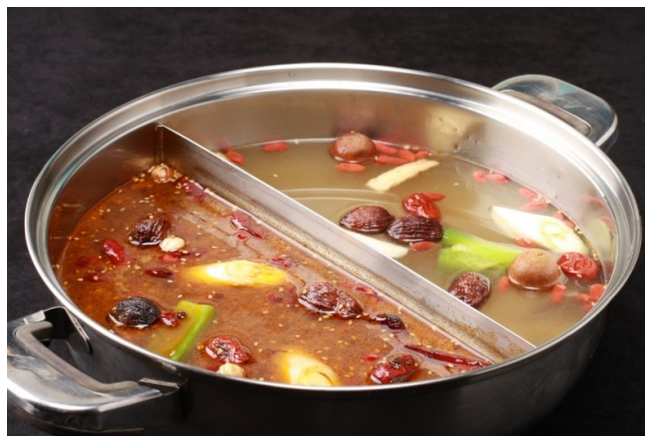
薬膳火鍋のスープ