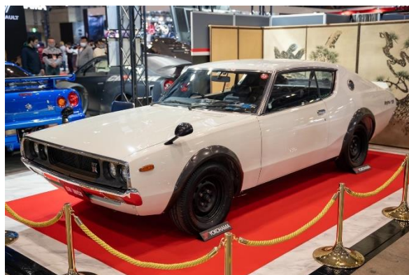
東京オートサロン2023の様子