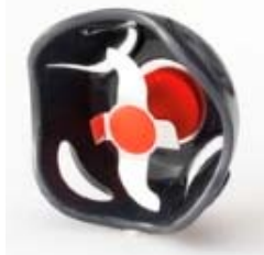
生の肉や魚を つぶす