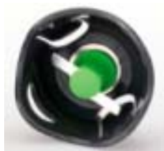
野菜・果物を つぶす・混ぜる

つぶす、混ぜる、泡立てる、砕くが1台で。先端アタッチメントを交換するだけで手軽に様々な料理を作ることができます。4種類のアタッチメントは使用する食材の色をイメージして色分けされているので、一目で使用したいアタッチメントがわかるのも魅力です。