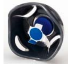
氷や凍らせた果物を 砕く