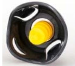
卵や生クリームを 泡立てる