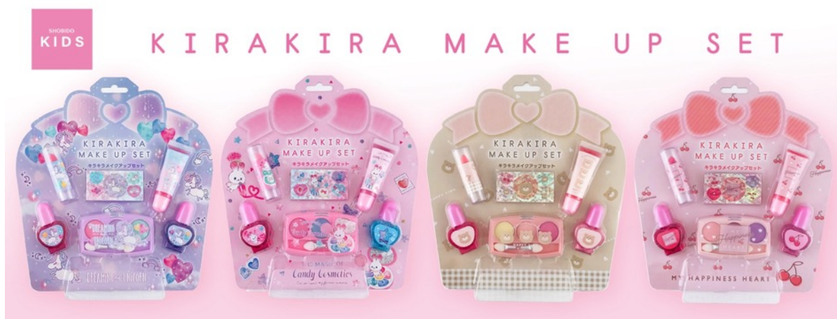
「キラキラメイクアップセット」（税込価格 1,100 円）

いずれも透明感のあるキッズのかわいらしさと、キッズが求める「ちょっとした大人っぽさ」を散りばめた、ときめきとワクワクに溢れたアイテムを揃えました。