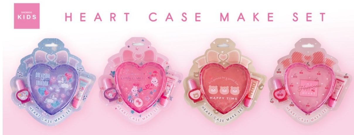
「ハートケースメイクセット」（税込価格 770 円）

アイメイク、リップ、ネイルまで粧うことができるフルメイクセットにキラキラ光るホログラムシールをセット