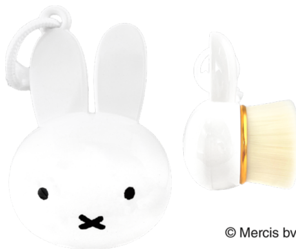
ブランドリニューアル新商品 「リッチホイップブラシ<ミッフィー>」 税込価格 2,420 円