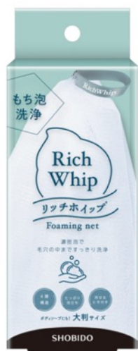
ブランドリニューアル 「リッチホイップ 泡立てネット」 税込価格 660 円

紫外線を浴びて、汗をかいて・・・と夏を超えた肌はダメージを溜め込みがち。 この夏、シリーズ累計販売数 100 万個販売を突破した「リッチホイップ」シリーズがブランドリニューアルしました。 4層構造の細かい網目でもっちり濃密泡を作ってくれる「リッチホイップ 泡立てネット」のほか、「2021 年度グッドデザイン賞」受賞の「リッチホイップブラシ SHINKA」、ブランドリニューアルと同時に発売された「リッチホイップブラシ<ミッフィー>」といった超極細毛が濃密泡を作り出す洗顔ブラシで、角質や毛穴に溜まった汚れを落としましょう。