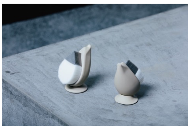
「2021 年度グッドデザイン賞」受賞 「リッチホイップブラシ SHINKA」 税込価格 3,630 円