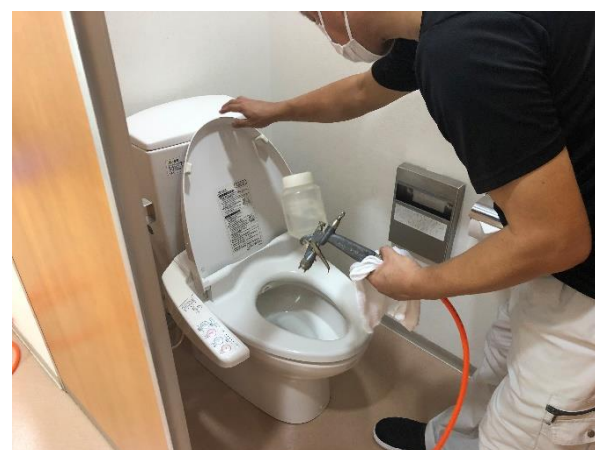
コーティングを施す様子