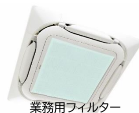
業務用フィルター