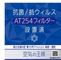
設置店舗用ステッカー

※業務用につきましては、下記【商品に関するお客様からの問い合わせ】にご連絡ください。