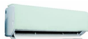
家庭用フィルター