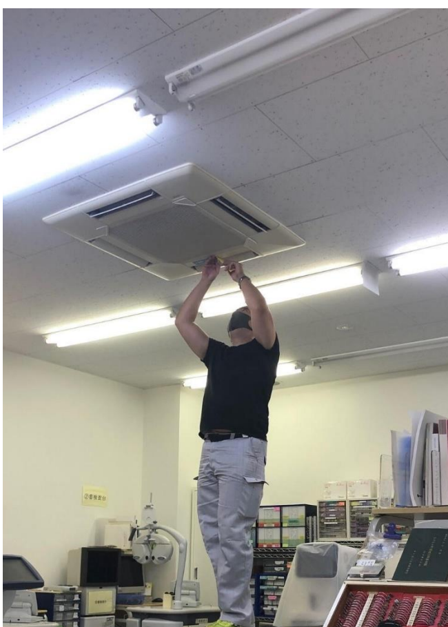
エアコンフィルターを取り付けている様子