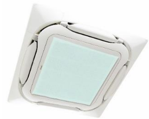
業務用フィルター

『空気の王様／AT254エアコンフィルター』は、チタニア系セラミックコート剤・AT254 を含浸させたエアコンフィルターです。空気中の菌・ウイルスの突起(スパイクタンパク質)がフィルターに付着すると、酸素と反応して菌・ウイルスの繁殖を抑制します。既存のエアコンの吸い込み口に取り付けるだけなのでどなたでも簡単に設置することが可能です。まさに“「エアコンにマスク」する空気清浄機”という新発想で開発した商品です。