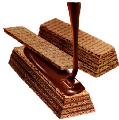
写真(左):「ネスレ キットカット グランウェファー 10個入り」