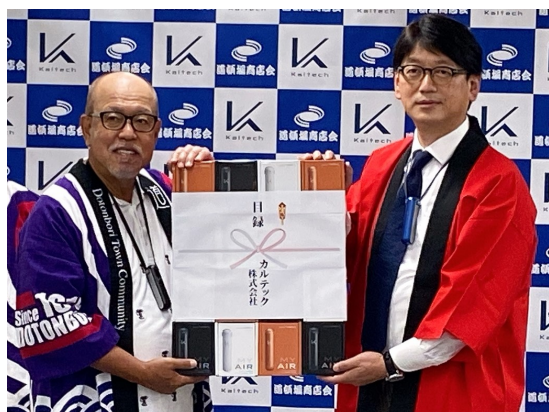
贈呈式の様子 （左から道頓堀商店会会長、カルテック社長）