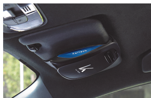
写真2：サンバイザー取付例

カルテック公式オンラインストア https://turnedk.com/kl-c01/