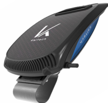
写真1：車載用光触媒除菌脱臭機 <KL-C01>