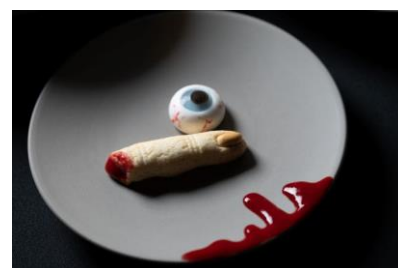
ハロウィンプティフル (目玉チョコレートと マシュマロ フィンガークッキー)