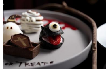
モンスターシュークリーム

提供価格 : ￥2,500 (税込 ￥2,750) 提供期間 : 10月1日(金) - 10月31日(日) 提供時間 : 12:00 - 17:00 詳細・予約 : https://bit.ly/HalloweenatFIVE