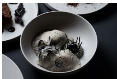
能登ポークバラ肉のブレゼ カカオニブの パン粉揚げ 黒米のリゾットと 黒トウモロコシ 黒トリュフソース