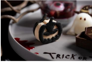
カボチャアイスクッキーサンド