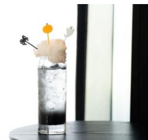
I sWitch (Mocktail)