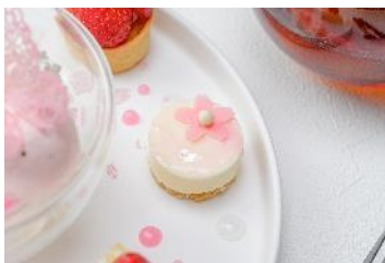
桜レアチーズケーキ