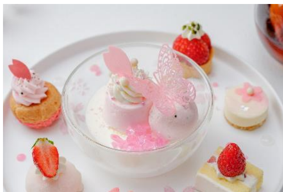
桜パンナコッタと桜餅アイスクリーム

心華やぐ可愛らしいケーキセットを、飲み替え自由なコーヒーや紅茶とともにゆったりとご堪能ください。