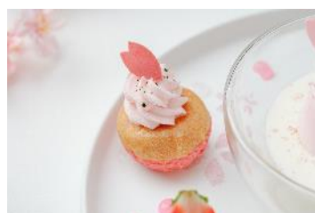
桜シュークリーム