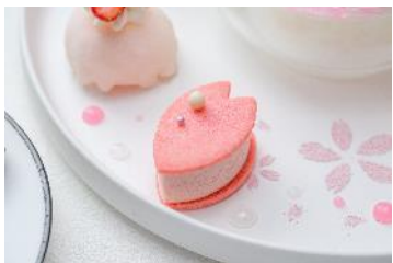
桜アイスサンドクッキー