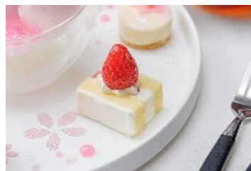
苺ショートケーキ