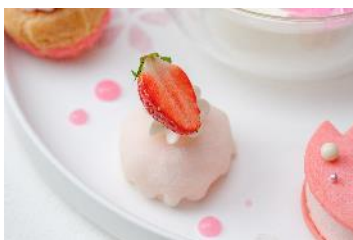
求肥の苺パルフェ包み