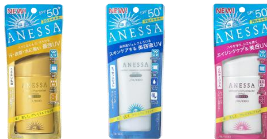
【キャンペーン対象商品】左から、