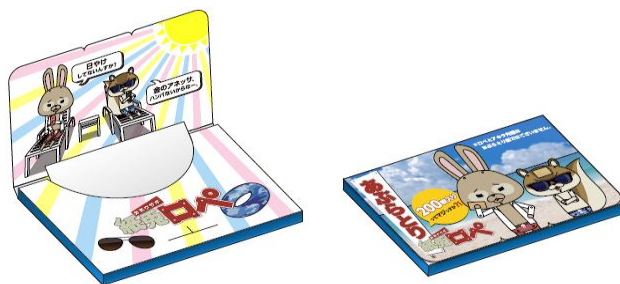
紙兎ロペ特製 あぶらとり紙(200枚入り)

※1【資生堂 YouTube 公式チャンネル】 http://www.youtube.com/user/SHISEIDOofficial