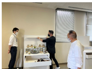
展示台の使い方を事前に確認