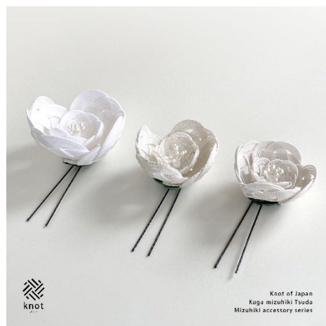
「水引」の老舗がつくるアクセサリ/津田水引折型