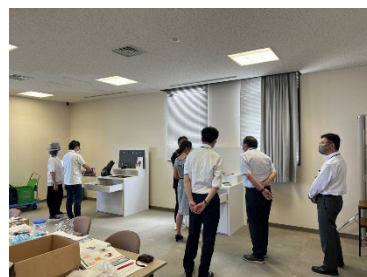
1社1時間。4日間かけて28社に対応