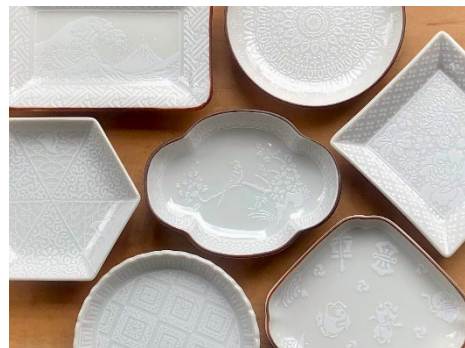
「白い」九谷焼/ビッグサンタ