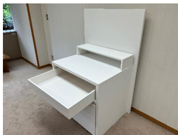
展示台の「試作」を事前に製作