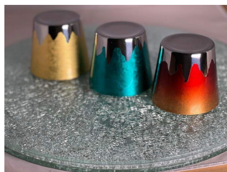
「10000分の1ミリ」の箔がつくる富士山/箔一