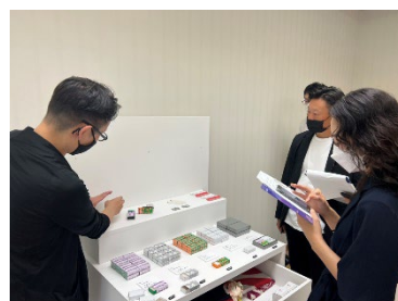
商品陳列の方針を指導