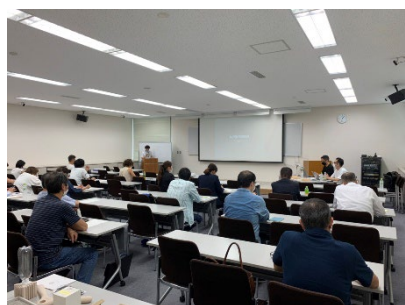
展示会集客セミナーの様子

2023年9月6日～9日: 会期中は、待機方法等、接客方法のアドバイスや陳列チェックを随時行う。