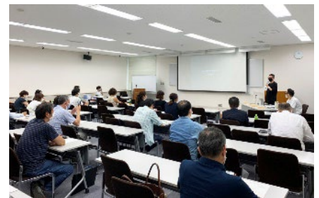
出展対策セミナー(石川県)