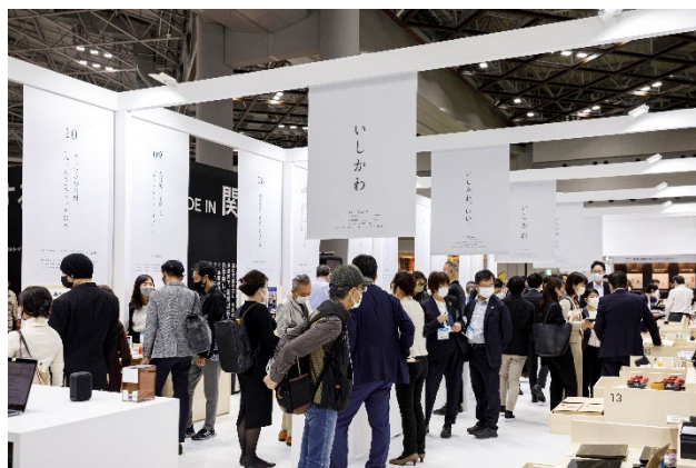
会場で最大級の集客を達成。