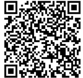
セミナー詳細ページ

オンライン:2022年6月9日(木)17:30~18:30 ※1時間程度の短時間版