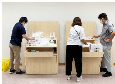
ディスプレイ指導(石川県)