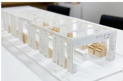
模型による解説(石川県)