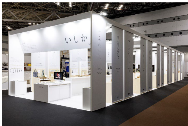
2021年10月、ギフトショー石川県ブース