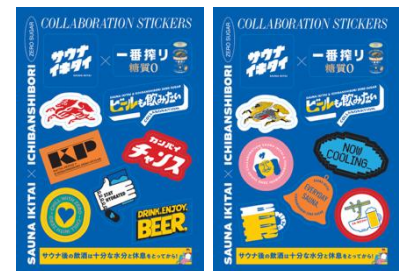
限定オリジナルステッカー (2 種類)