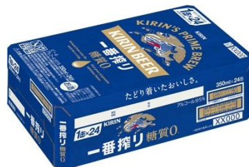
キリン一番搾り 糖質ゼロ 1 ケース (350ml 缶×24 本入り)

サウナですっきりした後はうまいサ飯とビールで乾杯しよう！サウナイキタイ（アプリ・WEB）からビールの写真と一緒に「サ活動を投稿」で「一番搾り 糖質ゼロ」とオリジナルステッカー 2 種が当たる！