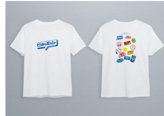
オリジナル T シャツ (20 名様)