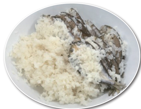
オイカワのナレズシ