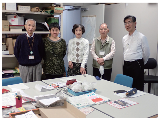
琵琶湖博物館フィールドレポータースタッフ