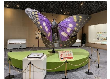
▲オオムラサキのオブジェ

本展示では、ゴルフ場の建設の影響によって減少しているオオムラサキや、温暖化によって増加しているナガサキアゲハの展示も行い、自然環境の変化によるチョウの移り変わりについて学べる展示となっています。