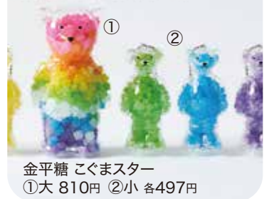
金平糖 こぐまスター ①大 810円 ②小 各497円