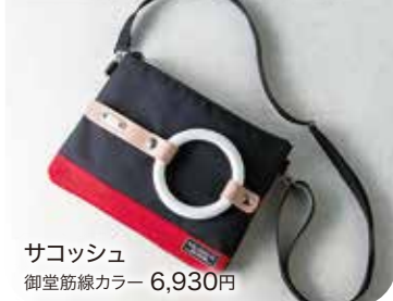
サコッシュ 御堂筋線カラー 6,930円