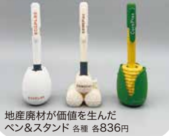
地産廃材が価値を生んだ ペン&スタンド 各種 各836円