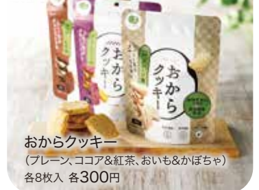
おからクッキー (プレーン、ココア&紅茶、おいも&かぼちゃ) 各8枚入 各300円