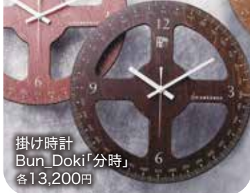
掛け時計 Bun_Doki「分時」 各13,200円