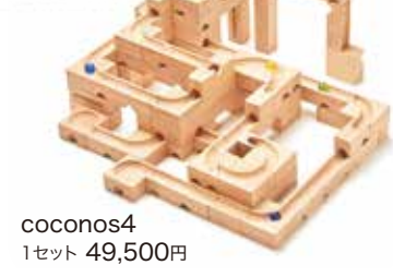
coconos4 1セット 49,500円