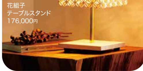
花組子 テーブルスタンド 176,000円