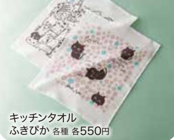
キッチンタオル ふきびが 各種 各550円