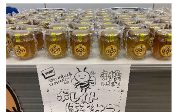
お土産のボレイトはちみつ