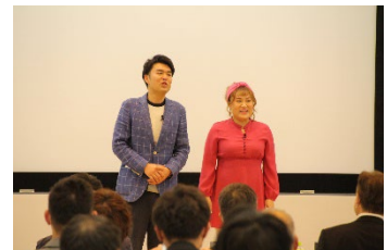
フォーリンラブさん