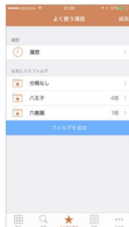
履歴・お気に入りフォルダ