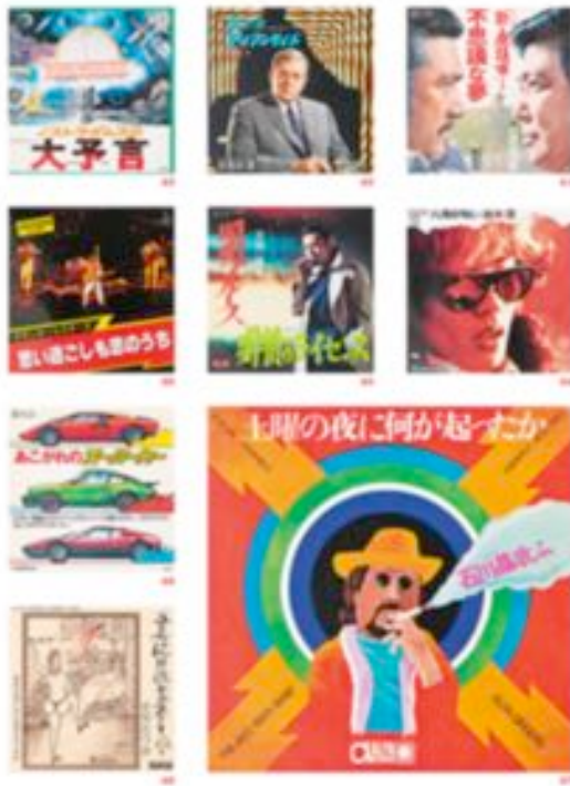
61* 橋本忍、石原信雄監督（1961年） 62* 斎藤寅次郎監督（1961年） 63* 佐伯清監督（1961年） 64* 佐伯清監督（1961年） 65* 佐伯清監督（1961年） 66* 佐伯清監督（1961年） 67* 佐伯清監督（1961年） 68* 佐伯清監督（1961年） 69* 佐伯清監督（1961年） 70* 佐伯清監督（1961年） 71* 佐伯清監督（1961年） 72* 佐伯清監督（1961年） 73* 佐伯清監督（1961年） 74* 佐伯清監督（1961年） 75* 佐伯清監督（1961年） 76* 佐伯清監督（1961年） 77* 佐伯清監督（1961年） 78* 佐伯清監督（1961年） 79* 佐伯清監督（1961年） 80* 佐伯清監督（1961年）