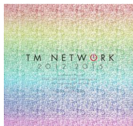
第1弾／TM NETWORK 30th 1984～ the beginning of the end