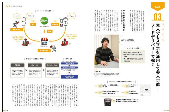
『ウーバーイーツ』の解説ページ