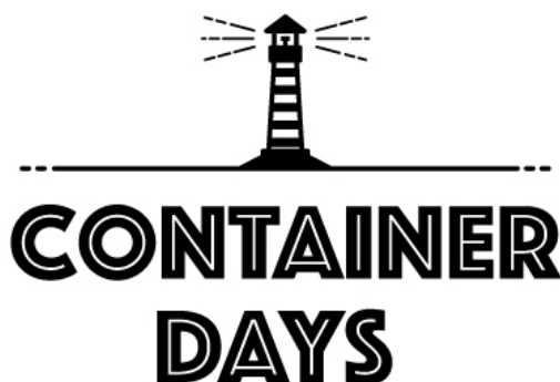
Japan Container Days ロゴ