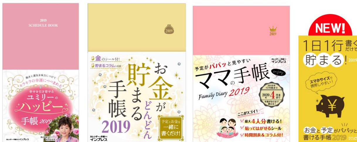
幸せを引き寄せる ユミリーのハッピー手帳 2019

インプレスグループでIT関連メディア事業を展開する株式会社インプレス（本社：東京都千代田区、代表取締役社長：小川 亨）は、「インプレス手帳」のラインアップのうち、「お金」「家族」「風水」などの暮らしに役立つ機能付き手帳を2018年9月7日（金）、14日（金）に発売いたします。