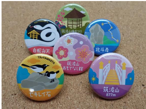
オリジナル記念缶バッジ（デザインはイメージ）

※2 ピンズは各コース、1回達成で1口応募できます（達成ごとに複数応募可）。必要事項を記載してメール（ヤマスタ事務局宛 yamasta-info@yamakei.co.jp ）にて応募ください。