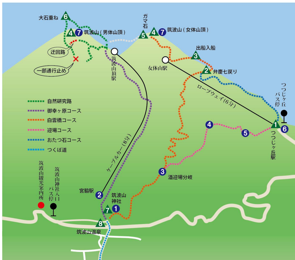
スタンプラリー コースマップ (▲●はチェックイン対象の場所)