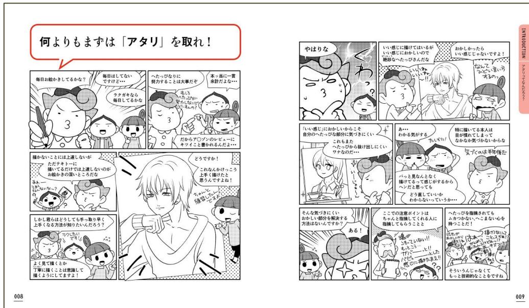
マンガを読みながら、学ぶ内容が理解できます。