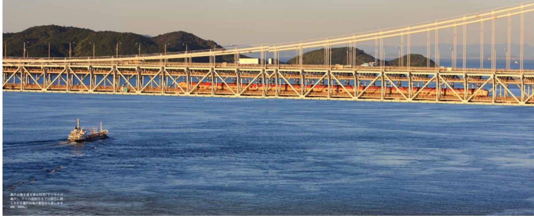
瀬戸内海を渡る瀬戸内大橋。瀬戸内海を渡るには、 瀬戸内海を渡るには、 瀬戸内海を渡るには、