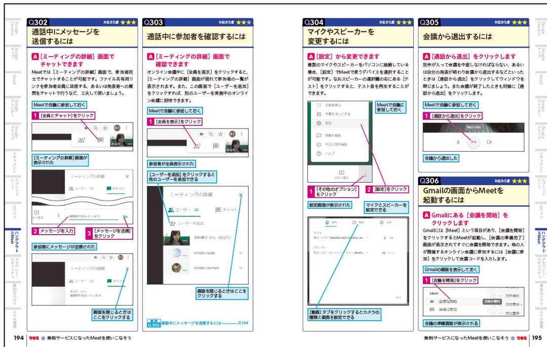
テレワークに必須のサービスを手厚く紹介

テレビ会議を手軽に実現する「ハングアウト」や「Meet」の操作方法をはじめ、「ドライブ」を使ったファイル共有・共同編集など、テレワークに必須の機能を詳しく紹介。また、仕事に使うパソコンを遠隔操作できる「リモートデスクトップ」の設定方法も丁寧に解説しています。この1冊でビジネスパーソンがGoogleサービスを使ったテレワークをすぐに実践できます。