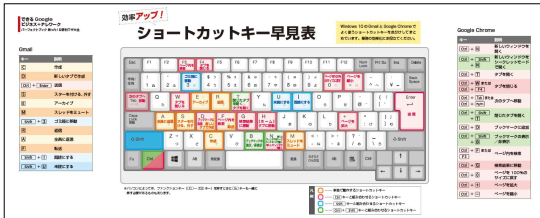
カバー裏にショートカットキー早見表を印刷

各章では主要なツールのショートカットキーを掲載。巻末の付録にショートカットキー一覧を収録したほか、GmailやGoogle Chromeなど日常的に使うツールのショートカットキー早見表をカバー裏に印刷。操作を短縮して、作業の効率をアップできます。