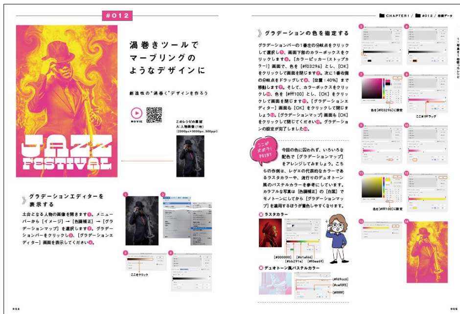
解説文や画面写真に付いている番号順に読み進めることで理解しながら操作できる

本書ではPhotoshopをはじめて使う方も迷わず操作できるよう丁寧に解説しています。書籍内の左側の解説文と、右側の画像の数字を順に追っていくことで手順が読み進められます。また、画面写真を多く用いているため、Photoshopの操作に慣れれば右側の画面写真の手順だけで作品が作れるように構成されています。さらに、操作の手順だけでなく、作品を作る上でのポイントや、レシピのアレンジ方法についても解説。1つのレシピを読めば、デザインのコツを掴めて、さまざまなビジュアルを作ることができます。