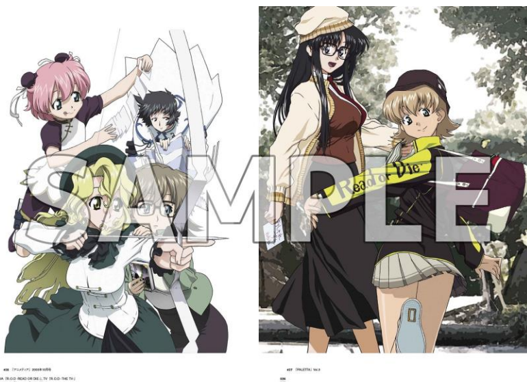
Chapter1:キャラクターデザイン作品 (R.O.D)