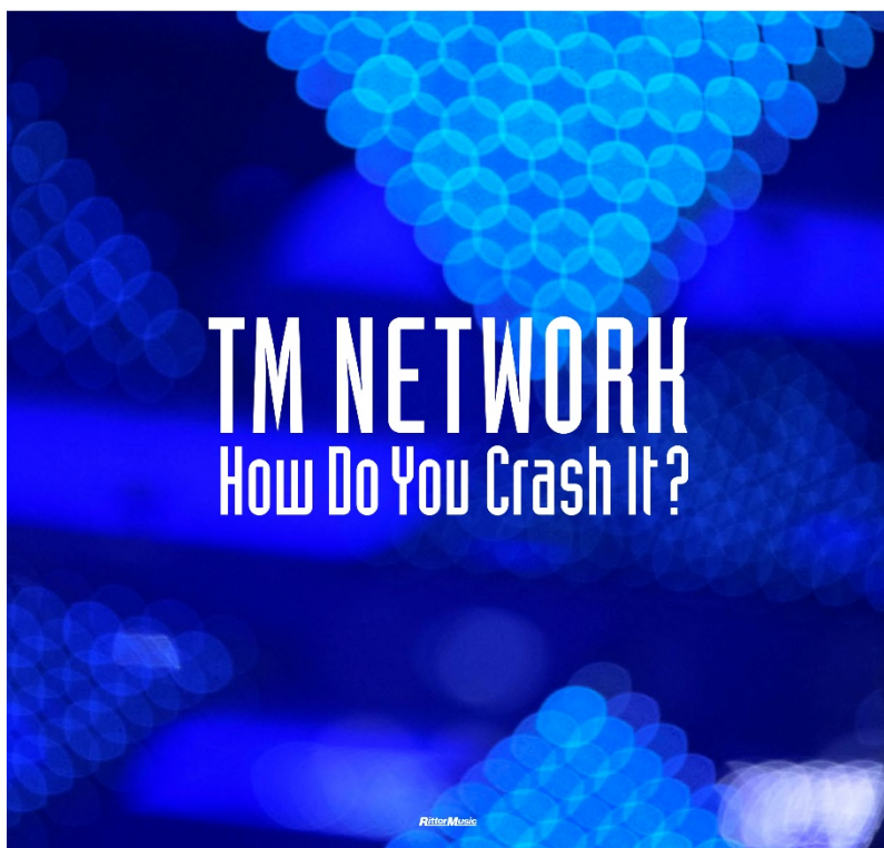
▲特典ケースのデザインイメージ

【株式会社リットーミュージック】 https://www.rittor-music.co.jp/