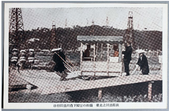
秋田油田の観光 秋田油田の観光