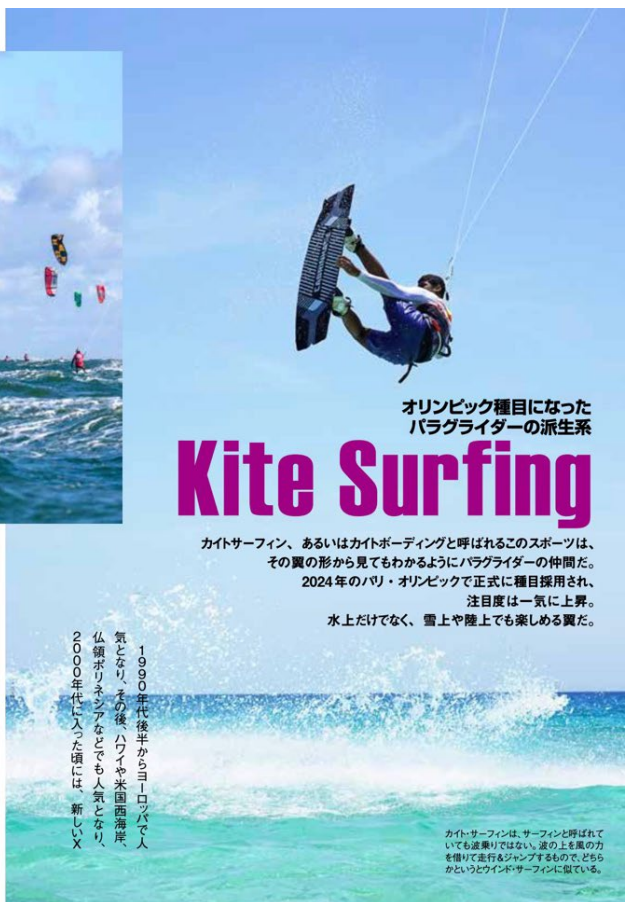
カイトサーフィンは、サーフィンと呼ばれるよりも遊樂りではない。波の上で風の力を借りて進むのがポイントなので、どちらかというとウインドサーフィンに似ている。

1990年代後半からヨーロッパで人気となり、その後ハワイや米国西海岸、仏領ポリネシアなどでも人気となり、2000年代前半には、新しいX