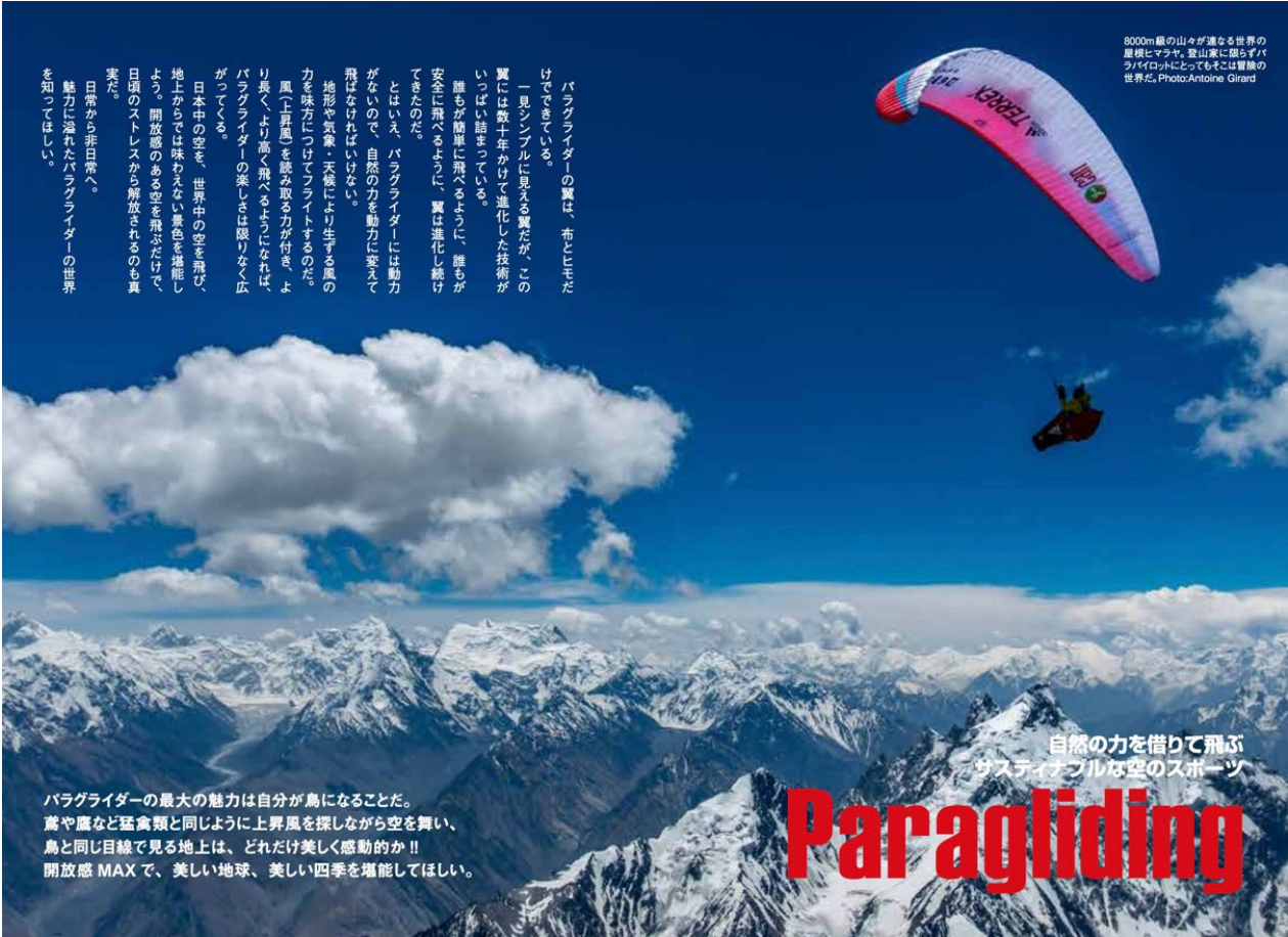
8000m級の山々が連なる世界の屋根にマテマ。登山家に限らずパラグライダーにとってもここは憧れの世界だ。

パラグライダーの翼は、布とモだけできている。 一見シンプルに見える翼だが、この翼には数十年かけて進化した技術がいっぱい詰まっている。 誰もが簡単に飛べるように、誰もが安全に飛べるように、翼は進化し続けてきたのだ。 とはいえ、パラグライダーには動力がないので、自然の力を動力に変えて飛ぶなければならない。 地形や気象・天候により生ずる風の力を味方につけてフライトするのだ。 風（上昇風）を捉える力が付く、より長く、より高く飛べるようになれば、パラグライダーの楽しさは限りなく広がってくる。 日本中の空を、世界中の空を飛び、地上からでは味わえない景色を堪能しよう。開放感のある空を飛ぶだけで、日頃のストレスが解放されるのも真実だ。 日常から非日常へ。 魅力に溢れたパラグライダーの世界を知ってほしい。