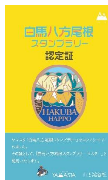
記念缶バッジ（左・デザインはイメージ）と達成認定証（右）