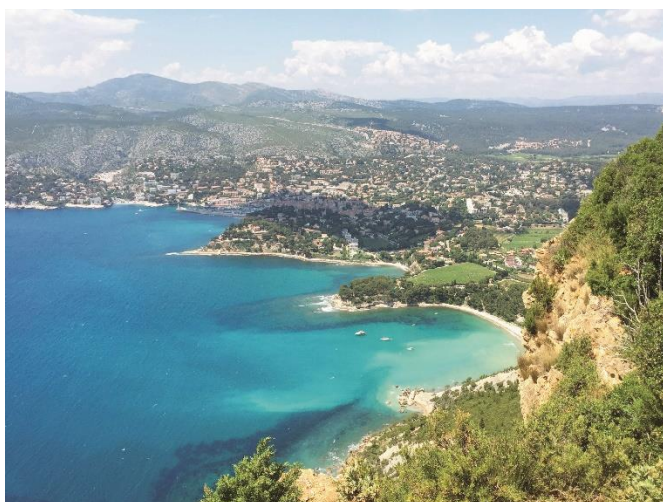
のどかさが感じられる地中海沿いエリア。