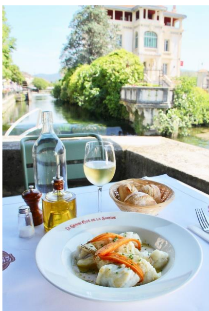
景色を楽しみながら、冷えたワインと、おいしい料理を食べられるブラスリー。