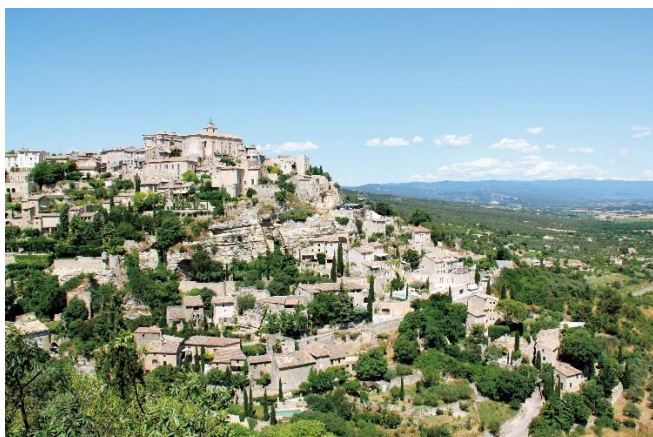
「フランスで最も美しい村」に認定されている天空の村、ゴルド。