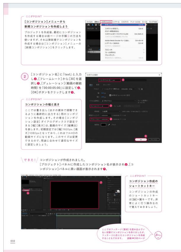
After Effectsでの動画制作の基本となる「コンポジション作成」から丁寧に解説