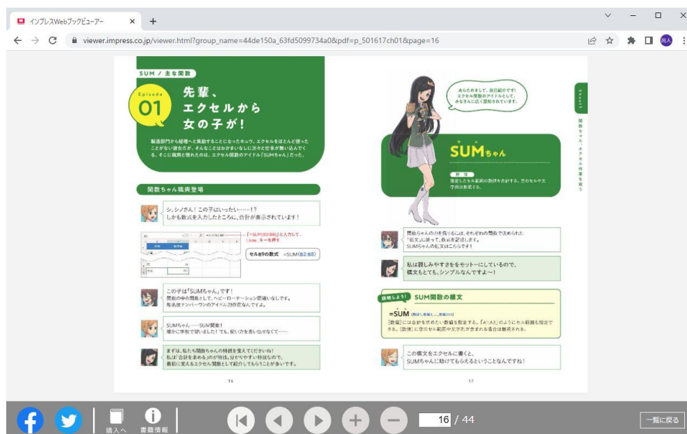
書籍の内容はWebブラウザで閲覧できます

書籍内容の提供には、自社開発の「インプレスWebブックビューア」を使用します。Webブラウザで紙面を閲覧できるので、場所や時間を選ばずにPCやスマートフォンなどから登録不要で利用できます。また、SNSで書籍の情報を共有したり、書籍の購入や詳細を確認したりできる機能も備えています。