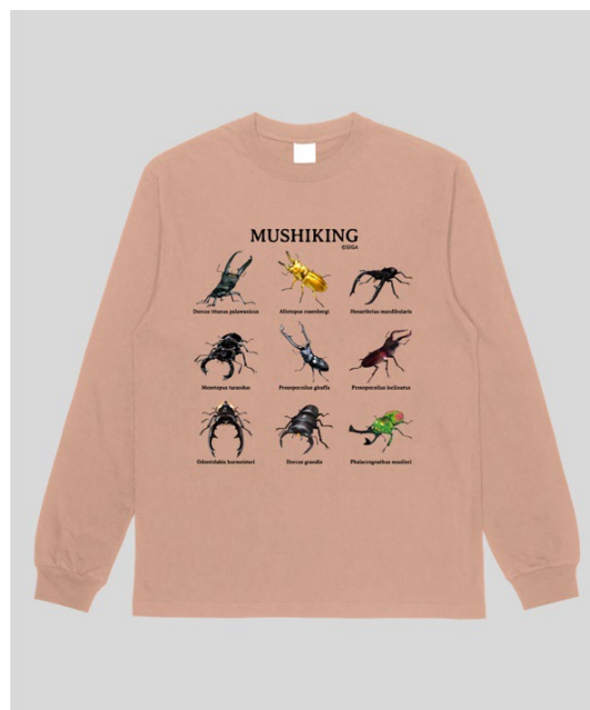
▲ムシキングロンT 9種の甲虫 クワガタ Ver./ダスティピンク