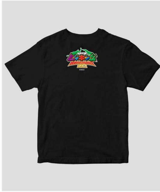
▲ムシキングTシャツ/ブラック（背面）