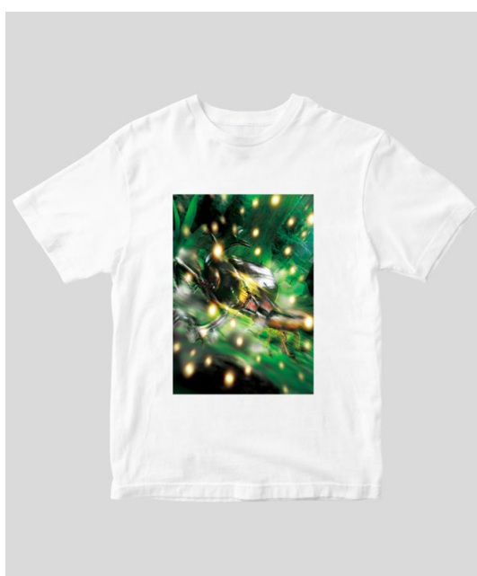
▲ムシキング T シャツ TypeE／ホワイト（前面）