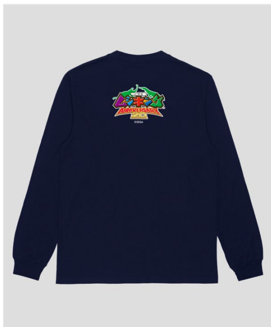
▲ムシキングロンT/ネイビー（背面）

『ムシキングTシャツ 9種の甲虫』 『ムシキングロンT 9種の甲虫』は、ムシキングに登場する人気のカブトムシとクワガタを9種類ずつ並べた「カブトムシ Ver.」と「クワガタ Ver.」の2パターンにて制作。それぞれの学名を記載して図鑑のような雰囲気に仕上げました。スタイリッシュなデザインなので、シンプルなコーディネートにも取り入れやすいです（※プリントは前面のみになります）。