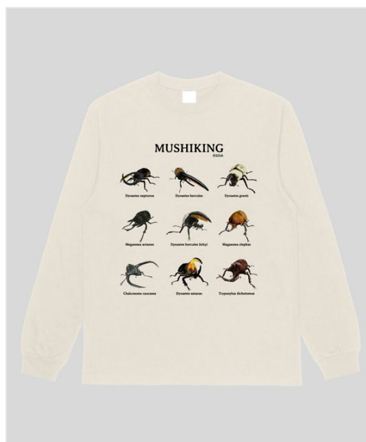
▲ムシキングロンT 9種の甲虫 カブトムシ Ver./アイボリー