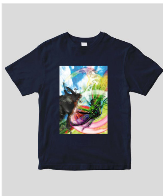
▲ムシキング T シャツ TypeD／ネイビー（前面）

T シャツのサイズはキッズサイズ（100～160）からアダルトサイズ（S～XL）まで、カラーはブラック／ホワイト／ネイビー／オリーブの全4色と、豊富なバリエーションをご用意。また、ロンTもS～XLサイズ、カラーはブラック／ホワイト／ネイビーの全3色からお選びいただくことが可能です（※ロンTはアダルトサイズのみとなっております）。