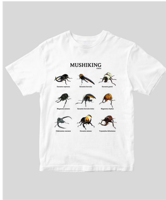
▲ムシキングTシャツ 9種の甲虫 カブトムシ Ver./ホワイト