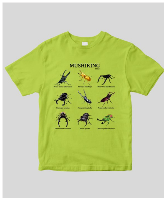
▲ムシキングTシャツ 9種の甲虫 クワガタ Ver./ライトグリーン