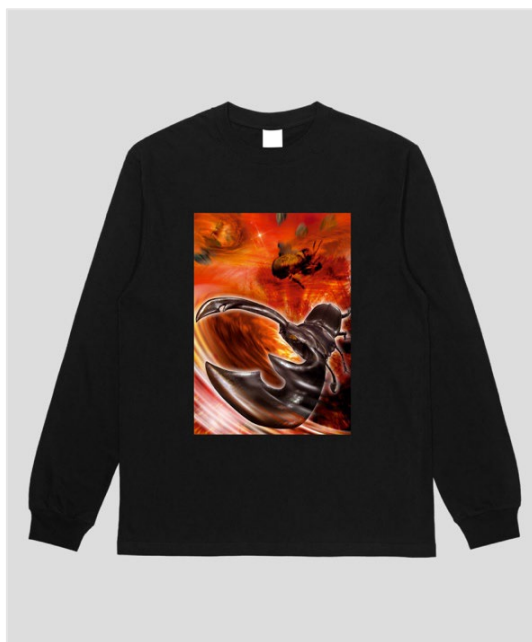
▲ムシキングロンT TypeB/ブラック（前面）