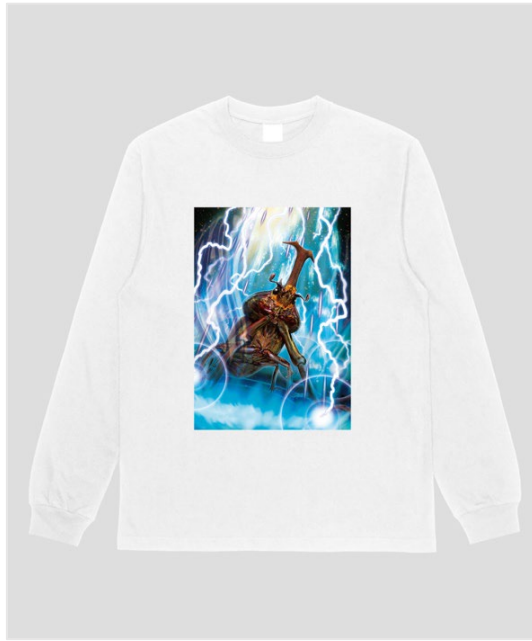
▲ムシキングロンT TypeA/ホワイト（前面）