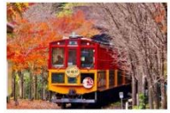
トロッコ列車の紅葉を堪能できる絶好スポット。JR木次線、奥出雲おろち号の紅葉を堪能できる絶好スポット。