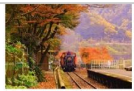
紅葉が美しいJR木次線の絶好景観。絶好景観であるJR木次線の名物列車「奥出雲おろち号」。

JR木次線「奥出雲おろち号」の紅葉を堪能できる絶好スポット。JR木次線、奥出雲おろち号の紅葉を堪能できる絶好スポット。