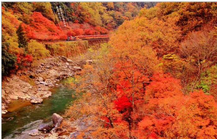
保線車の紅葉や車窓から楽しめる絶好景観の鉄道。外国人観光客の訪日観光コースにも組み込まれており、過半数を占めている。

乗客の一人は、「引退の理由として、国産車唯一の国産車行きのついでに今年秋で引退する。この秋はそんな名物列車に乗りたいとお別れを誓いにいきたい。」