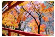
トロッコ列車の紅葉を堪能できる絶好スポット。JR木次線、奥出雲おろち号の紅葉を堪能できる絶好スポット。