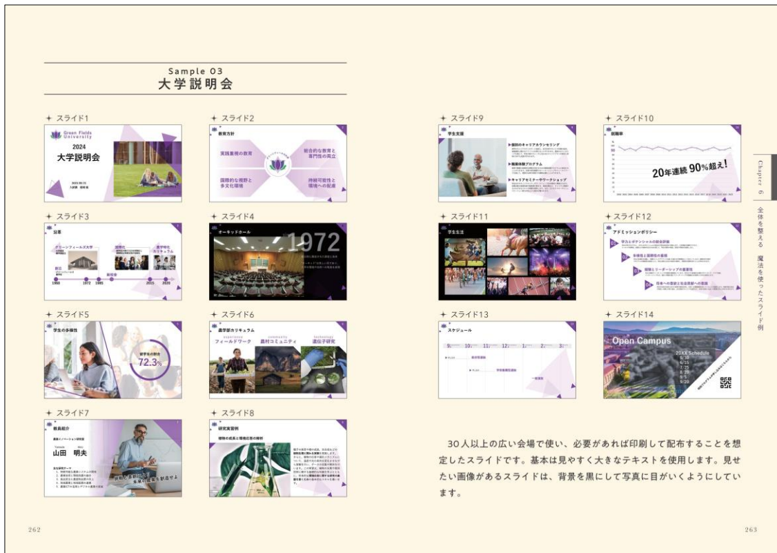
サンプルスライドも豊富で、資料全体の雰囲気やメリハリのつけ方を学ぶことができます