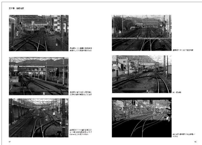
著者自ら取材・撮影した写真を豊富に掲載