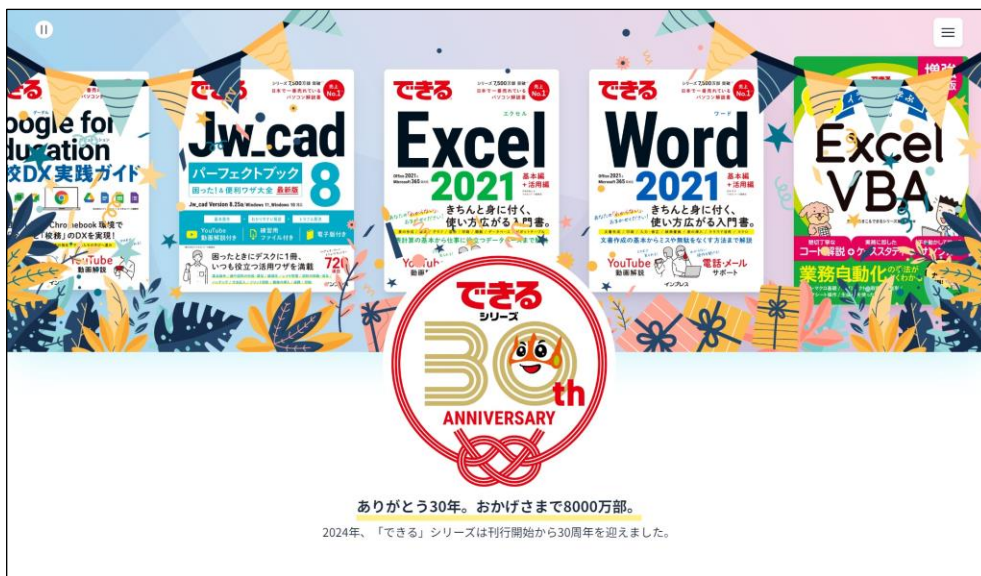
パソコンでの表示

『「できる」シリーズ30周年記念サイト』 https://dekiru.net/30th