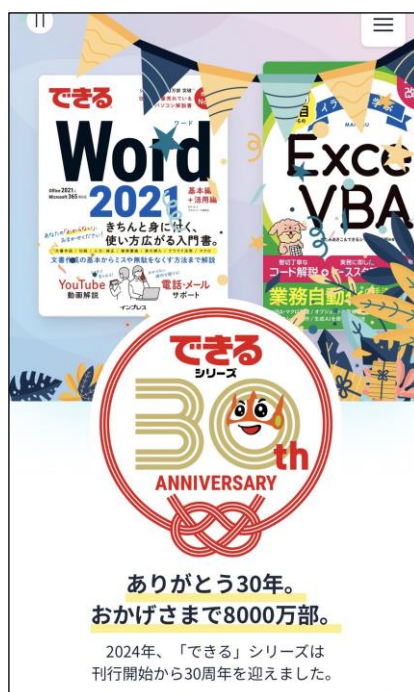
スマートフォンでの表示