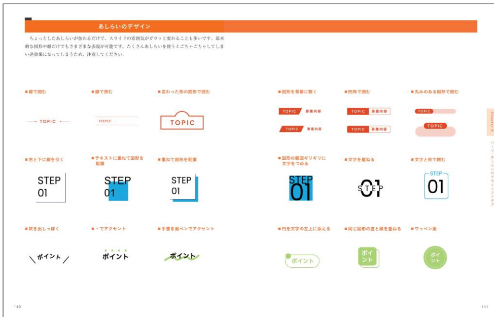
あしらいのデザインの紙面