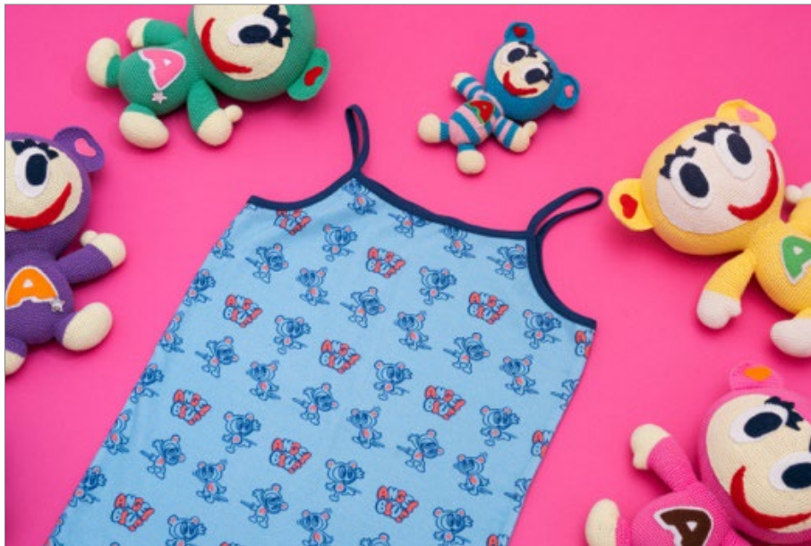
『エンジェルブルー・ナカムラクん総柄キャミソール』