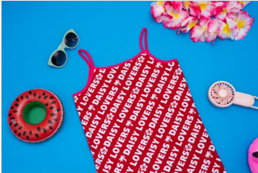
『デージーラヴァーズ総柄キャミソール』