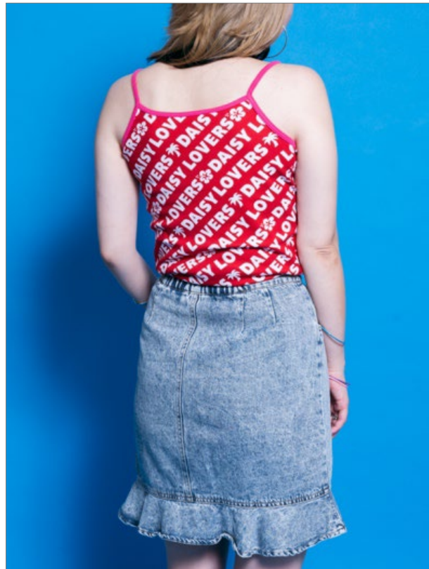
『デージーラヴァーズ総柄キャミソール』（M サイズ着用、モデル身長 157cm）

本商品は数量限定の予約販売で、販売期間は 2024 年 6 月 20 日（水）正午から 2024 年 7 月 21 日（日）まで（※売り切れ次第終了）となっております。2024 年 8 月中旬より順次発送予定です。