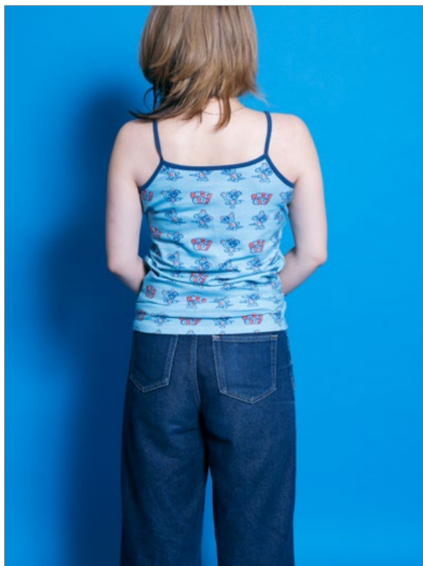
『エンジェルブルー・ナカムラクん総柄キャミソール』（M サイズ着用、モデル身長 157cm）