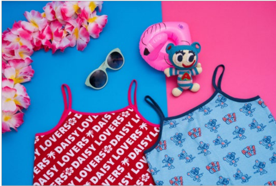
左から『デイジーラヴァーズ総柄キャミソール』、『エンジェルブルー・ナカムラクン総柄キャミソール』