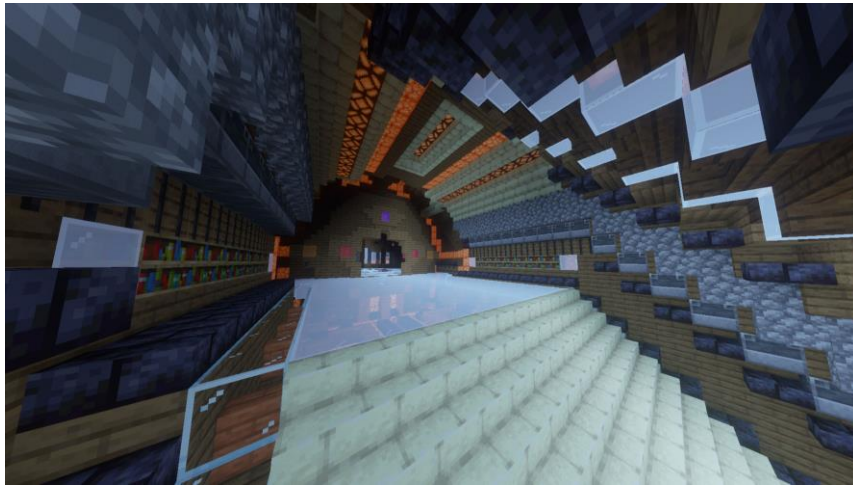
探検心を刺激するデザインの異世界感漂う廊下