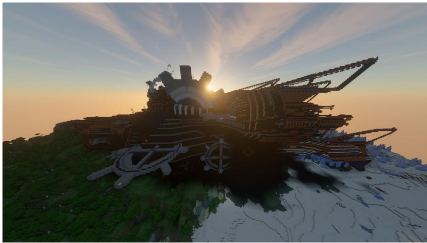
スチームパンクとファンタジーが融合した幻想的な空飛ぶ図書館