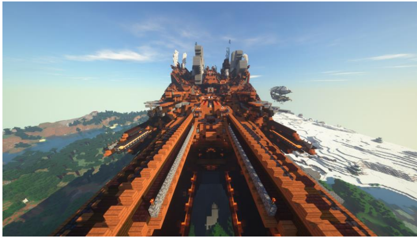
細部まで作り込まれたデザインが魅力の巨大な蒸気船が舞台