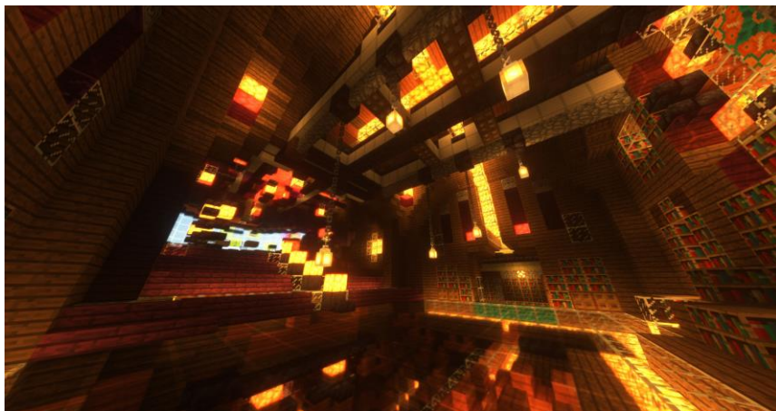
ファンタジーの世界観を彷彿とさせる図書館のインテリア