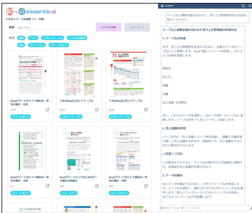
「テーブルと関数を組み合わせて、売り上げ管理表を作る方法を教えてください。」と質問した例

知りたい手順などをシンプルに検索して回答するのはもちろん、生成AIの技術を取り入れたことで、これまでにない使い方も可能です。例えば「ピボットテーブルと関数を組み合わせて、売り上げ管理表を作る方法を教えてください。」といった質問に対しても、回答が可能です。この他にも英語に翻訳して回答するなど、ユーザーの皆さまの創意工夫で様々な使い方ができる可能性を秘めています。