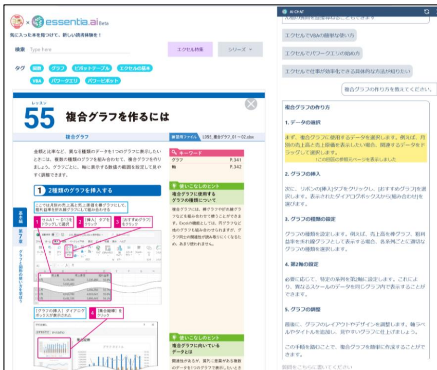
回答文をクリックすると、該当する紙面が表示されます

単純なキーワードを使った検索ではなく、自然文で利用できるのが大きな特長です。もちろん、回答も自然文で表示され、回答文をクリックすると関連性の高い紙面を表示することもできます。本サービスでは1冊だけを対象に回答を引き出すのではなく、複数の書籍を横断して回答文を生成しており、様々なニーズにも対応します。