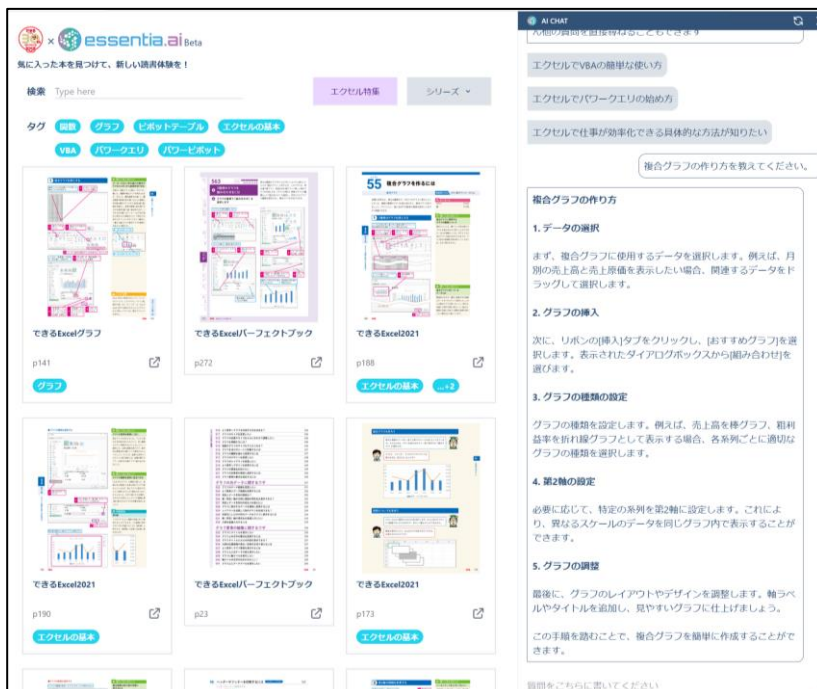
「AI CHAT」機能では入力された質問に対して、自然文で回答を生成します

本サービスにはExcel関連の「できる」シリーズ書籍を対象に、会話形式で回答を引き出すAI CHAT機能が搭載されています。トップ画面の右上にある「AI CHAT」ボタンをクリックし、表示されたチャット画面に知りたいことや調べたいことを入力するだけで利用できます。